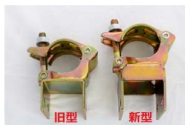
(新・旧クランプの差違)